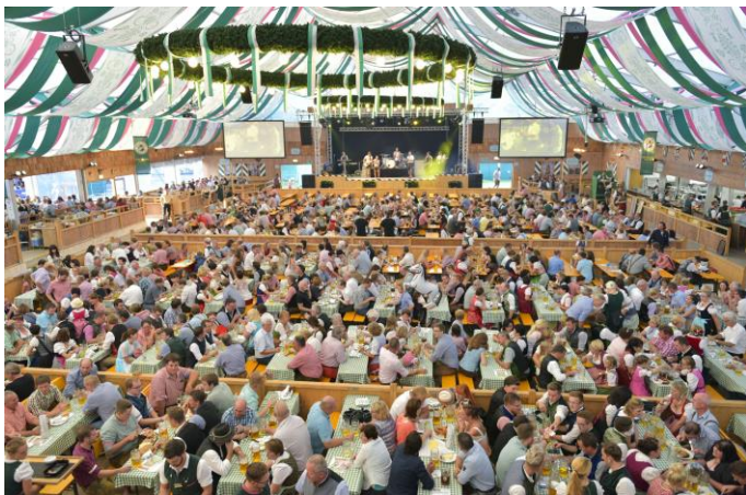
Le festival comprend 7 tentes à bière avec 26 500 places. Les propriétaires des tentes à bière vendent plus de 700 000 «Maß» (1 litre de bière) chaque année.