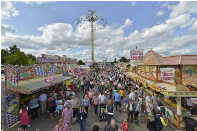
"Straubinger Gäubodenvolksfest": Le plus grand festival de bière de Bavière en août avec 1,4 million de visiteurs.

Il faut savoir que l'entrée est gratuite pour les 450.000 milles des visiteurs qui viennent chaque année donc l'exposition est un endroit de rencontre idéal pour faire la connaissance des technologies nouvelles et de la région.