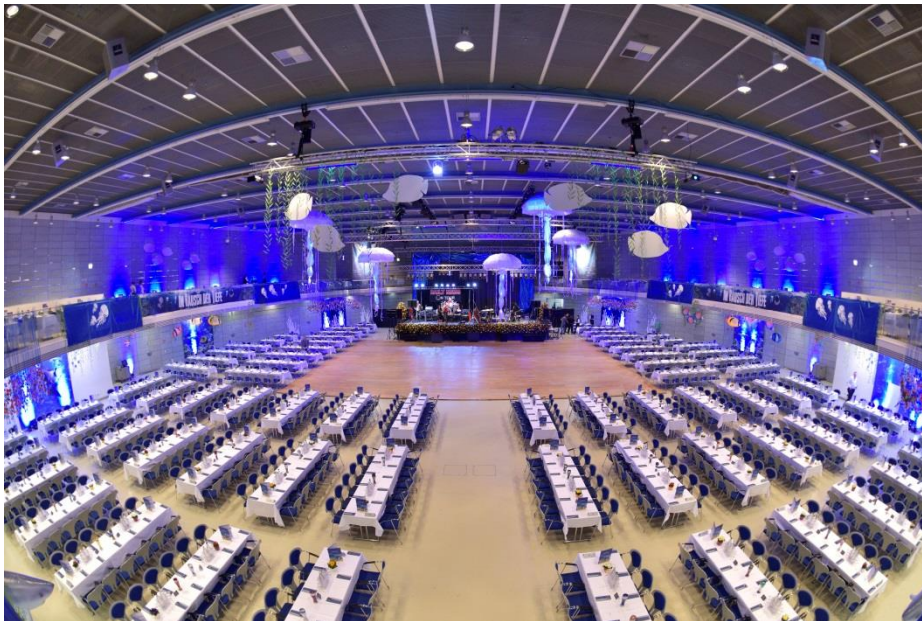
Die Bälle in der Joseph-von-Fraunhofer-Halle (06. Januar bis 13. Februar 2018) stellen jährlich einen Höhepunkt zum Jahresanfang dar (Foto Bernhard, Joseph-von-Fraunhofer Halle zur Ballsaison).

Hinweis für die Redaktion: Weitere Presstexte und attraktive Fotos in Druckqualität finden Sie im Internet unter www.ausstellungen-gmbh.de im Bereich Info&Service.