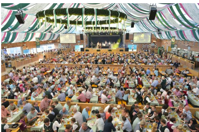
Festival zahrnuje 7 pivních táborů s 26 500 místy. Hostinci pivních stanů prodávají každý rok více než 700 000 "Maß" (1 litr piva).