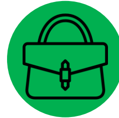
Handtaschen, kleine Damenrucksäcke...