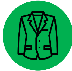
Sakkos, Blazer, Blouson...