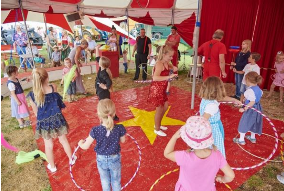
Nicht nur zuschauen, sondern selbst einmal zum Star in der Manege werden: Traditionell beliebt bei den kleinen Besuchern ist auch die Zirkusschule mit eigenem Mitmach-Programm.