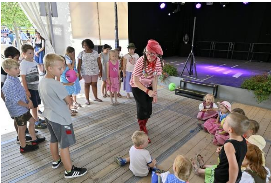
Leuchtende Kinderaugen garantiert sind auch bei den Vorstellungen des Nostalgie Circus Carlos.