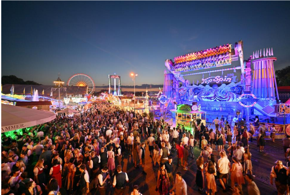
Bayerns zweitgrößtes Volksfest lockte in diesem Jahr an elf Tagen mehr als 1,3 Millionen Gäste an.