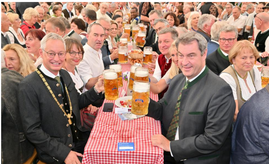
Weitere Höhepunkte waren neben der Eröffnung durch den Bayerischen Ministerpräsidenten Dr. Markus Söder das große Blasmusikkonzert, die Live-Spektakel im Historischen Bereich und auch die Lampionfahrt mit Niederfeuerwerk.