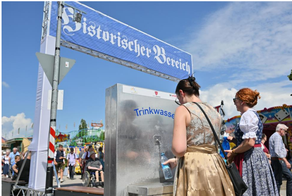
Eine willkommene Erfrischung bot für viele Gäste der in diesem Jahr erstmals zur Verfügung stehende Trinkwasserbrunnen.