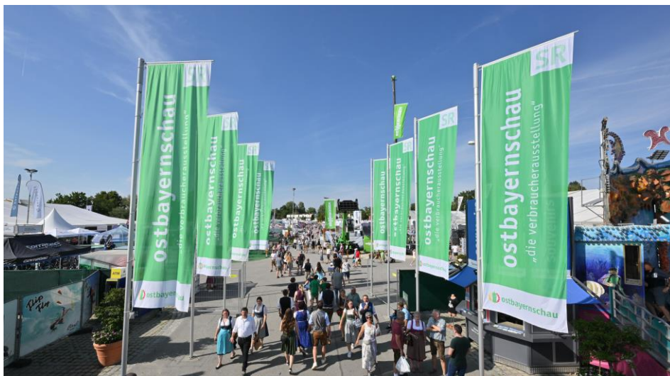
Die Ostbayernschau hat heuer über 420.000 Besucher anlocken können.