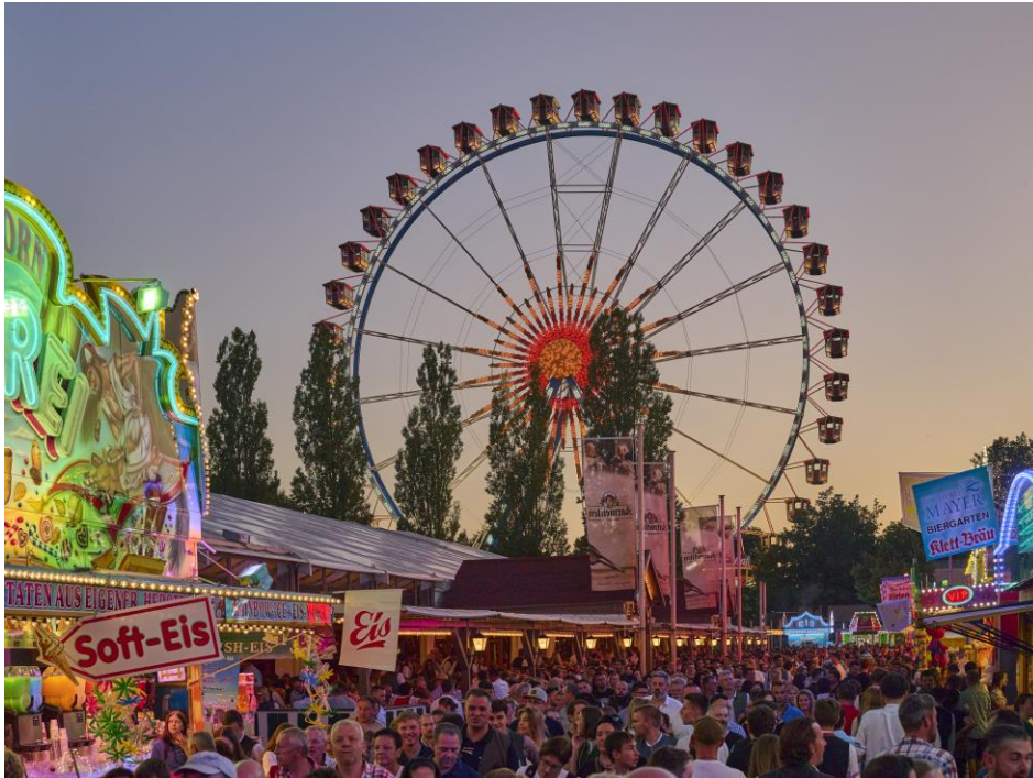
Bayerns zweitgrößtes Volksfest will die Besucher vom 9. bis 19. August 2024 mit ca. 130 Beschickern begeistern.