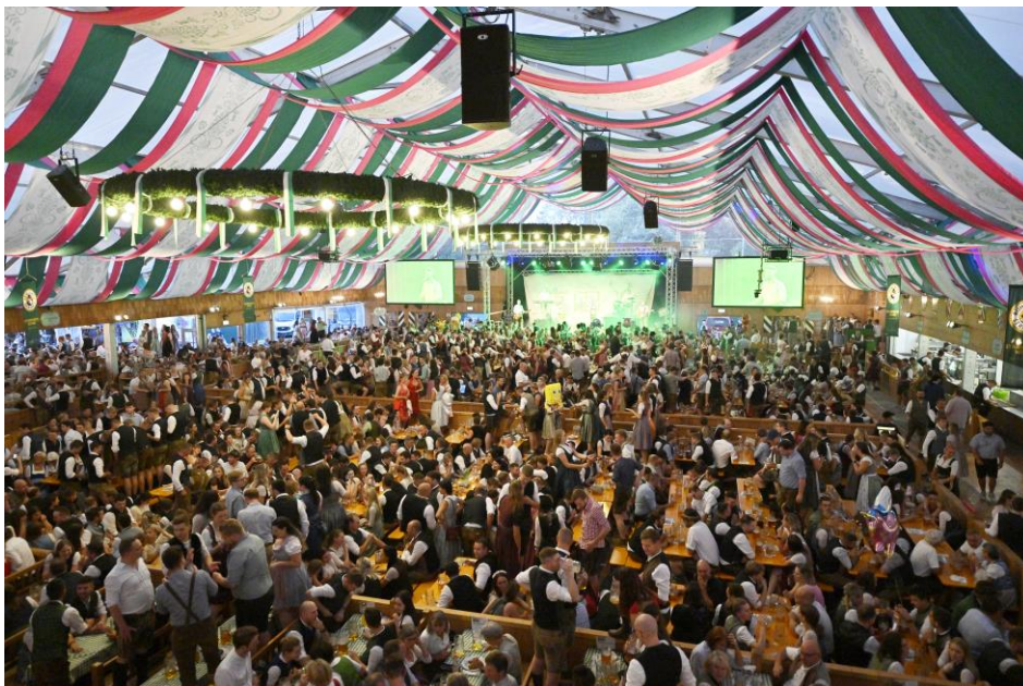
Der Preis für eine Maß Bier liegt heuer in den sieben Festzelten zwischen 12,70 Euro und 12,75 Euro.